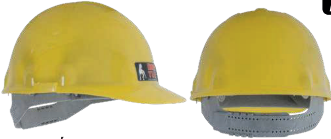
SUSPENSIÓN CON INTERVALOS